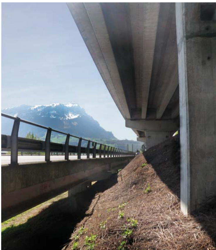
Die A2 zwischen Schwyz und Brunnen ist geprägt von vielen Brücken. Über 500 Brückenlager müssen ersetzt werden (im Bild die Brücke Urmiberg).

Eine Reduktion von Fahrstreifen wird ab 2020 nötig, wenn Betoninstandsetzungen, Belagersatz- und Abdichtungsarbeiten sowie die Installation von Fahrzeugrückhaltesystemen ausgeführt werden. Bei der Brücke Sechzehni muss zudem das SBB-Schutzdach ersetzt werden.