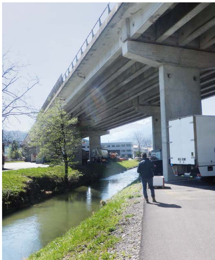
Gewerbezone, Wohngebiete, intakte Natur und die Autobahn. Letztere wird während der nächsten einhalb Jahre instand gesetzt (im Bild die Brücke Sechzehni).

An der 1964/1965 erbauten Unterführung Kantonsstrasse im Bereich Anschluss Brunnen werden, abgesehen vom Ersatz der Lager, dieselben Arbeiten wie vorstehend ausgeführt. Zusätzlich werden auch hier der Abbruch der Fahrbahnübergänge sowie die Neuerstellung der Fugenbereiche nötig.