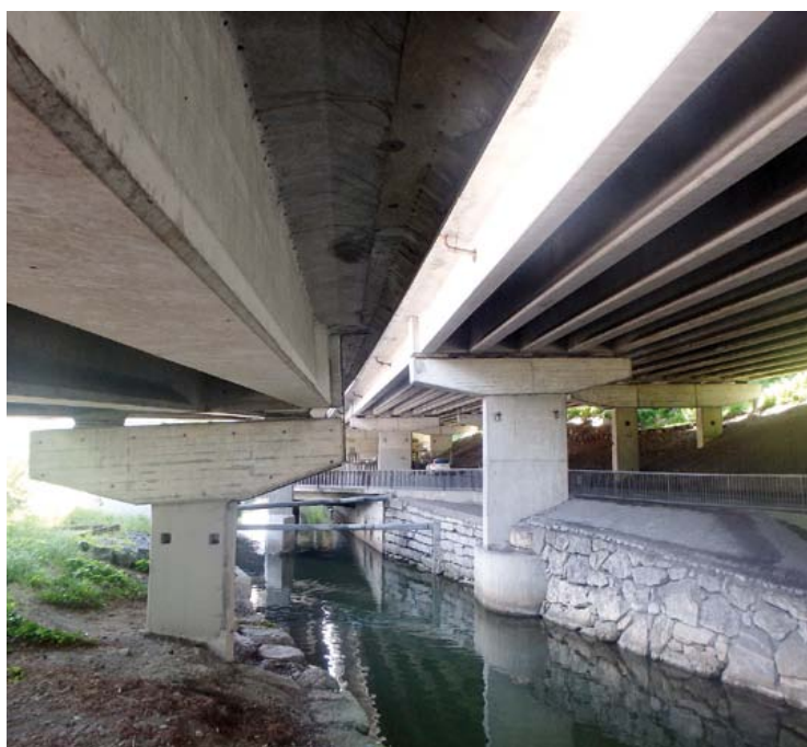
Unteransicht Brücke Zingel bei Seeweren.

Im Bereich der Brücke Zingel ist der Baugrund teilweise setzungsempfindlich. Aus diesem Grund stehen einige der zahlreichen Stützen der Brücke auf Fundamenten, die wiederum auf Pfählen stehen. Diese tragen die Lasten in den tragfähigen Fels ab. Im Bereich einer Stütze ist der Fels sehr steil abfallend (vergleiche Abbildung), sodass das heute bestehende Fundament mittels Felsanker an die Felswand rückverankert ist. Diese Felsanker können aufgrund ihrer Lage nicht kontrolliert werden. Darum wird eine Pfahlfundation realisiert, welche die Lasten direkt in den Fels in rund 30 Meter Tiefe abträgt. Diese Arbeiten dauern von September bis November 2019.